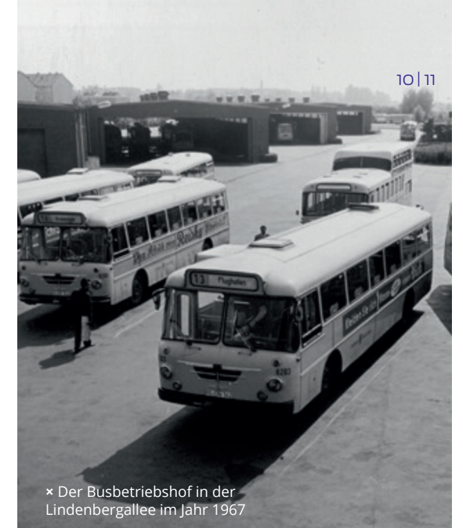
× Der Busbetriebshof in der Lindenbergallee im Jahr 1967

Ab den 50er-Jahren gewannen die Busse wieder zunehmend an Bedeutung. Dem trug der Bau des Busdepots am Lindenberg Rechnung. Auf