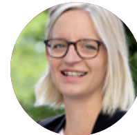
Maria Stenzel Braunschweig Stadtmarketing GmbH

Von wegen dunkle Jahreszeit: Im Winter erstrahlt die Löwenstadt im Lichterglanz des Braunschweiger Weihnachtsmarktes und der weihnachtlich geschmückten Innenstadt. Die neue Buslinie 423 bringt Sie von der Weststadt oder aus dem östlichen Ringgebiet ins Weihnachtswunderland.